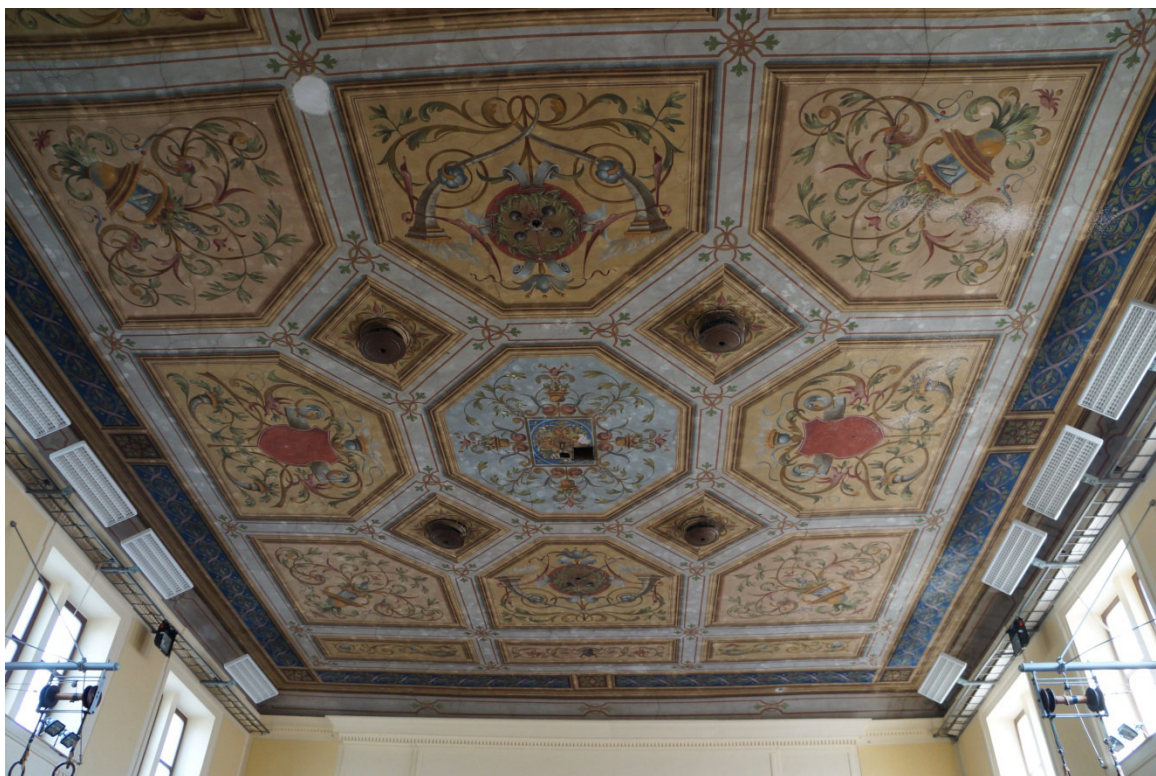
- původní strop -