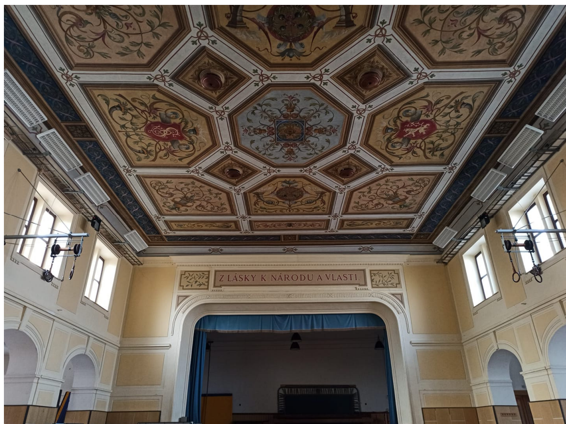
- po rekonstrukci -